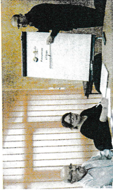
Les parrains sont prêts à vous accueillir dans ces ateliers

Une nouvelle activité pour l'association Passerelle en Dombes dès ce samedi 12 mars, de 8h30 à 11h30 à l'ancienne bibliothèque d'Ambérieux-en-Dombes (à côté du local des pompiers). L'association a décidé d'ouvrir un atelier pour préparer vos CV et lettres de motivations en vous apportant aide et conseils sur la manière de les remplir. Cet atelier est ouvert aux citoyens des 6 communes desservies par l'association (Ambérieux, Civrieux, Aïs, Ste-Olive, St-Jean de Thuirigneux, Savigneux). C'est gratuit. Tous les publics sont ciblés et plus particulièrement les étudiants pour les jobs