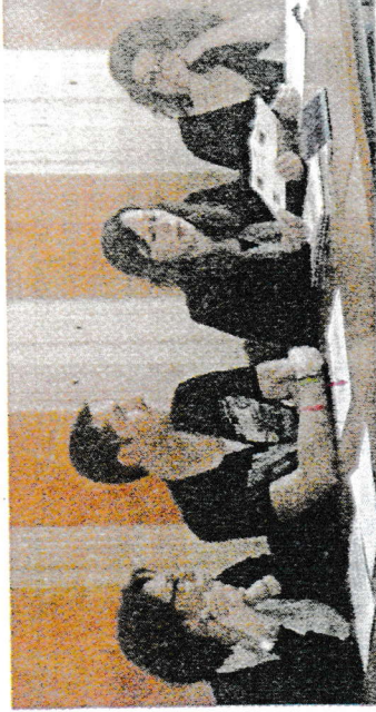
Le bureau lors de l'assemblée générale

Parmi les activités existantes au sein de l'association : accueil de loisirs périscolaire, les mercredis après-midi vacances. Le PASAE concerne les activités après l'école existante avec les communes de Fareins, Sainte-Euphémie, Saint-Didier, Saint-Bernard. Le nombre d'enfants est en baisse : 65. Les TAP